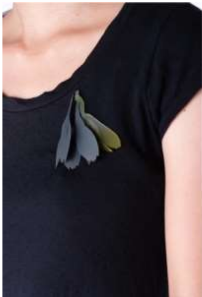
默默 Majority with Silence

2010 德國TALENTE國際競賽特展 補助年度：100年度 ( 收錄於2012專輯 )