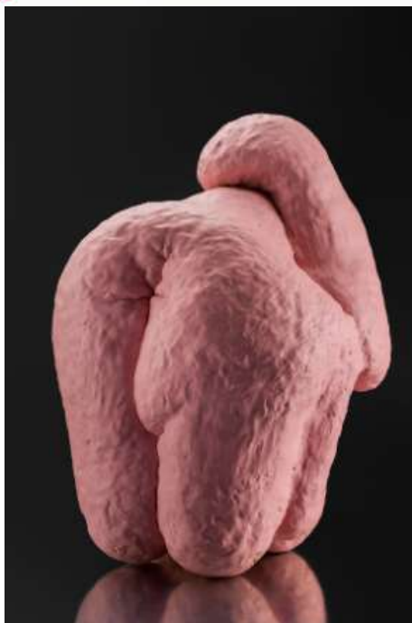
The dream of flesh