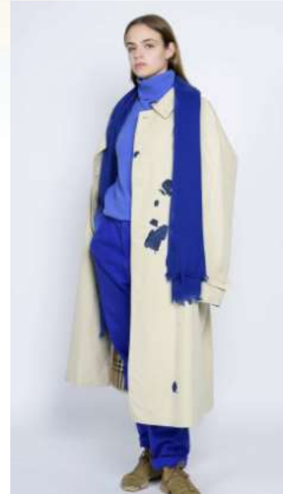
Reparierter Burberry-Mantel und Kaschmirpullover