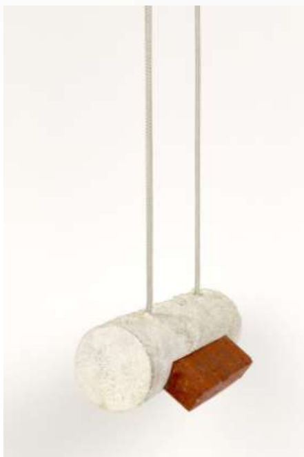
Still in Cylinder