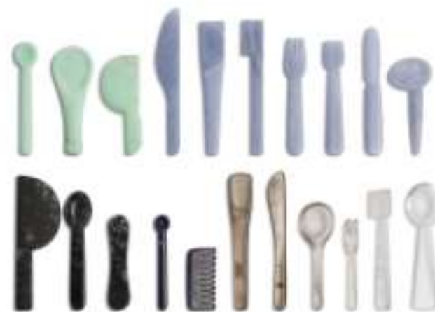
Integrating the sacred and the profane in everyday objects