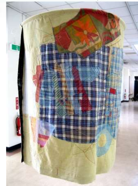
試衣間 Fitting Room

2012 德國TALENTE國際競賽特展 補助年度：101年度 ( 收錄於2013專輯 )