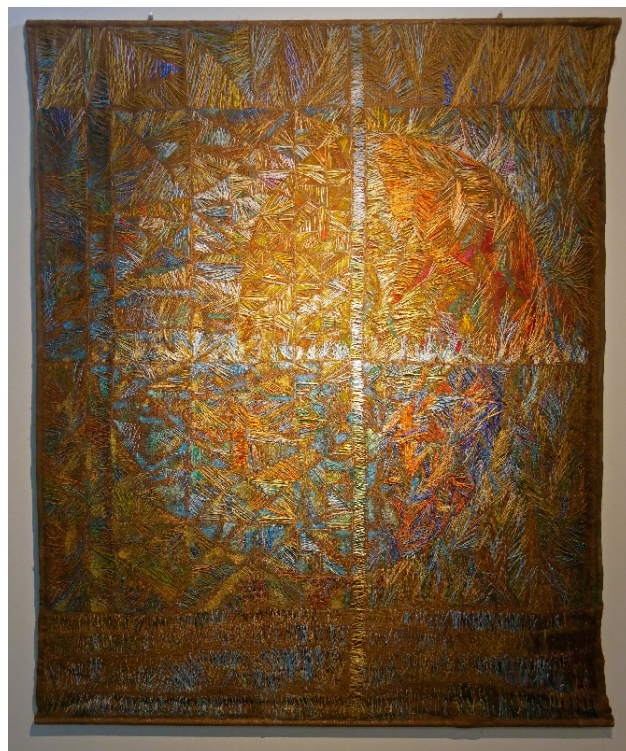
作品名：Letter to Helena ,2018 作者： Dobrosława Kowalewska 國家：PL