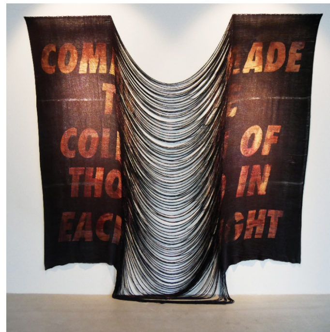
作品名：Solidarity,2017 作者： Alex Younger 國家：IUSA