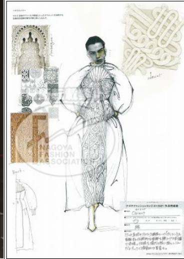
【 Orient 】