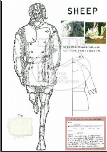
【 SHEEP 】