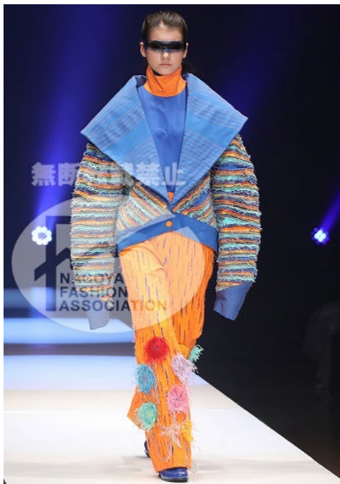
【 Vistosa Play A/W 2021 】

Hay Mar Win 新加坡 Raffles College of Higher Education