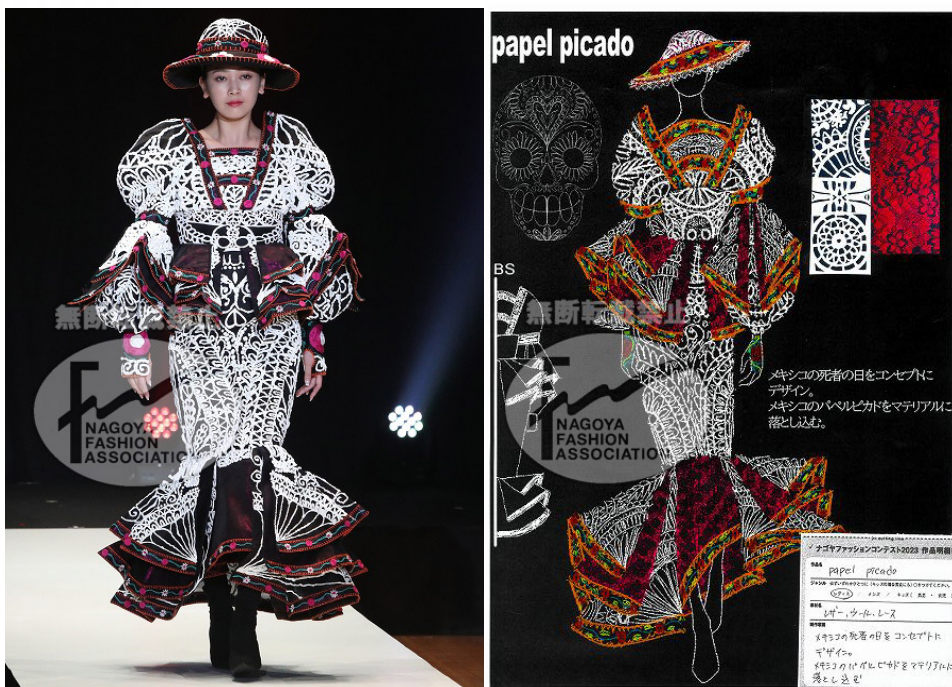
【 papel picado 】