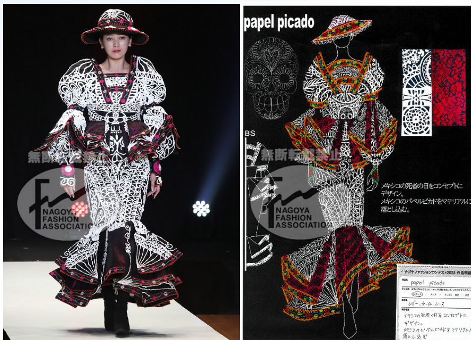
【 papel picado 】