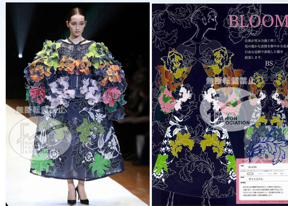
【 BLOOM 】