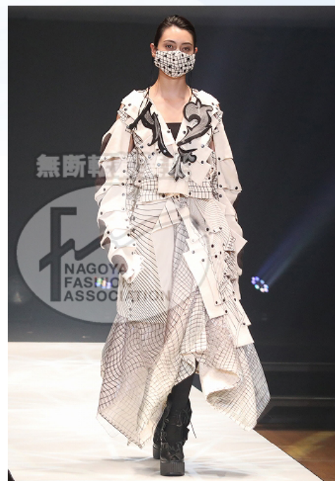
【 First Kunst 】

Hay Mar Win 新加坡 Raffles College of Higher Education