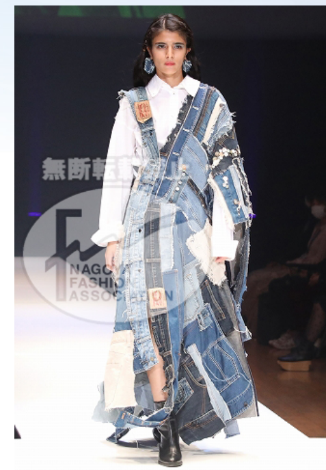
【 あみ 】