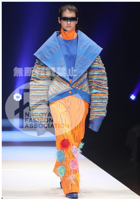
【 Vistosa Play A/W 2021 】

Hay Mar Win 新加坡 Raffles College of Higher Education