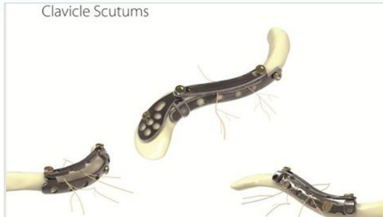
神經護盾 Clavicle Scutum