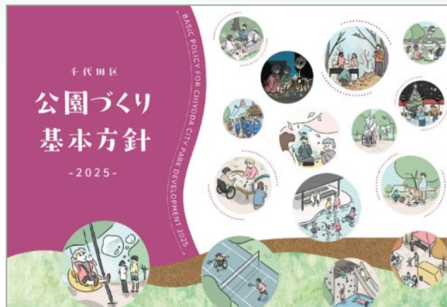
Chiyoda City Park Development Plan