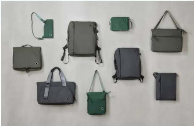
uF DIRECTOR' S BAG, STAND POUCH and Other bags