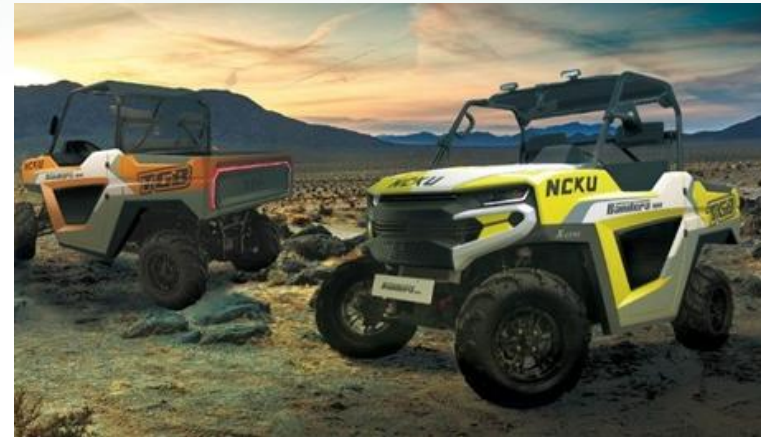
Bandera 1000 全地形載具 Bandera 1000 UTV