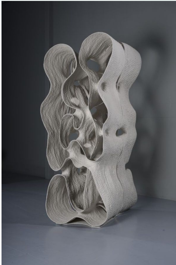
2015 – 35 Yunghsu Hsu