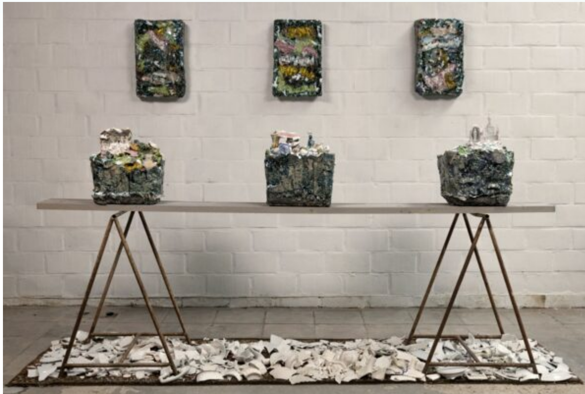
Paradiso eclettico di terra Malfliet Yves