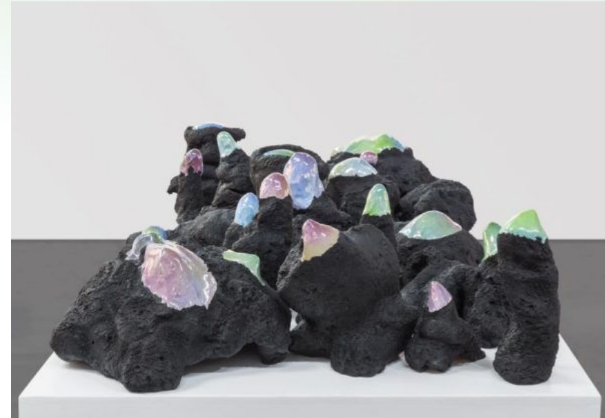
A soft land no longer distant Arancio Salvatore